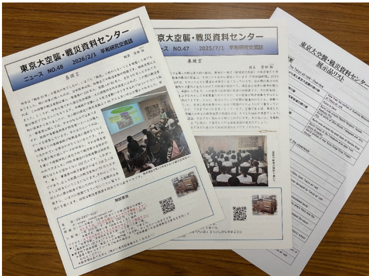
東京大震災・戦災資料センターの展示品リスト (右) 東京大震災・戦災資料センター発行のニュース (左と中) 訪問した際にニュースを4号分いただきました ご恵贈いただきありがとうございます 2026. 06. 20 撮影