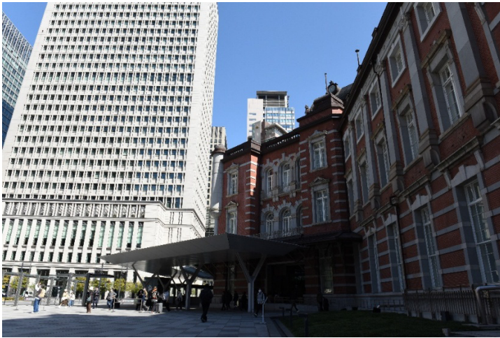
2026. 03. 07 東京駅 丸の内 北口

東京駅に到着すると、まず目に飛び込んできたのは、視界を埋め尽くすような巨大なビル群であった。京都とは異なる圧倒的な都市の密度と、洗練された街並みが目の前に広がる。駅の規模の大きさや人の多さ、大阪や京都も負けてはいないと思うが、さすが東京！である。集合場所は普段テレビや写真などで見ていた有名なレンガ造りの駅舎の中である。駅の中が広く集合場所に辿り着くのが大変だった。そこで10時30分に集合し東京駅から地下鉄に乗るため大手町駅（東京メトロ・半蔵門線）まで徒歩で移動した。歩きながら立ち並ぶ高層ビルをながめると、普段見慣れている景色とは全く違う都会の雰囲気である。特にビルの高さにはずっと驚かされ、東京の街の大きさを改めて実感した（受講生のなかには大阪とさほど変わらず驚かないとの声もあり！）。