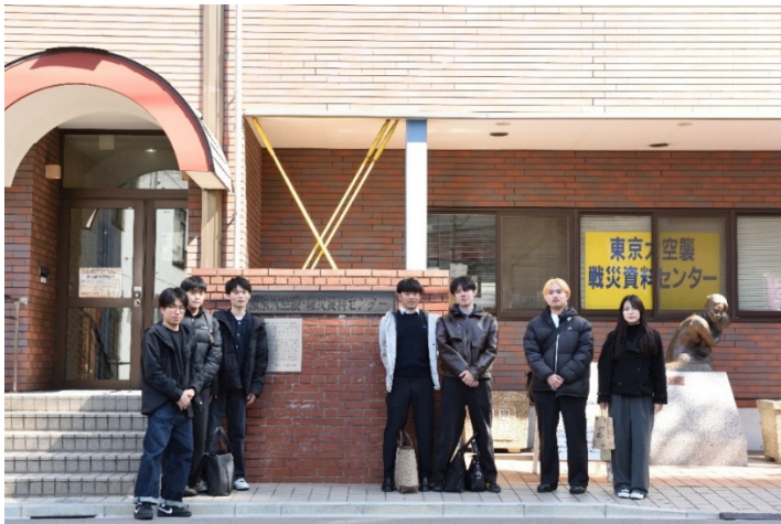
2026. 03. 07 東京大空襲・戦災資料センター 第1グループ