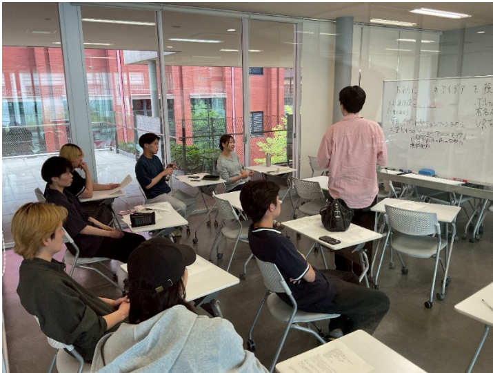
2026.05.20 授業のようす 龍谷大学和顔館の教室にて 若い世代が東京大空襲に関心をもつようになるためのアイデアを出し合っている

今回の平和スタディツアーでは予算の都合上1泊2日から日帰りの訪問となり、1か所のみの施設訪問となってしまったため少し心残りはあった。しかし、当初の訪問予定であった靖国神社や遊就館、上野動物園なども近くにあるため、東京大空襲・戦災資料センターへ訪れる際にはぜひこれらの施設にも足を運んでもらいたいと思う。私たちと同じ若い世代の多くの人に、その思いを伝えたいと考え、次のように、いくつかアイデアを出し合った。