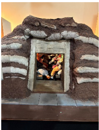
2026. 03. 07 撮影 展示：防空壕の再現模型（全体） 東京大空襲・戦災資料センターにて