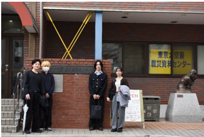
2026. 03. 19 東京大空襲・戦災資料センター 第2グループ