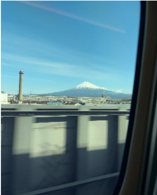
2026. 03. 07 富士山 新幹線の車窓から 新富士駅付近

東京駅に到着すると、まず目に飛び込んできたのは、視界を埋め尽くすような巨大なビル群であった。京都とは異なる圧倒的な都市の密度と、洗練された街並みが目の前に広がる。駅の規模の大きさや人の多さ、大阪や京都も負けてはいないと思うが、さすが東京！である。集合場所は普段テレビや写真などで見ていた有名なレンガ造りの駅舎の中である。駅の中が広く集合場所に辿り着くのが大変だった。そこで10時30分に集合し東京駅から地下鉄に乗るため大手町駅（東京メトロ・半蔵門線）まで徒歩で移動した。歩きながら立ち並ぶ高層ビルをながめると、普段見慣れている景色とは全く違う都会の雰囲気である。特にビルの高さにはずっと驚かされ、東京の街の大きさを改めて実感した（受講生のなかには大阪とさほど変わらず驚かないとの声もあり！）。