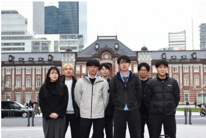
2026. 03. 07 訪問後 東京駅丸の内口にて 第1グループ

新幹線を利用して京都や大阪、神戸へそれぞれ帰った。行きの車内では観光に近い雰囲気や高揚感もあったが、帰りはそれぞれが見学内容を振り返りながら静かに過ごしていた。ただ、それは決して暗い気持ちではなく、東京大空襲という戦時下の出来事を自分のこととして受け止めたゆえの重みであったと思う。新幹線の車窓から見える都会の夜景を眺めながら、今回のスタディツアーで得た「平和への視点」をこれからの大学生活や日常の中でも大切に持ち続けようと、強く心に刻んだ。現地を訪れてはじめて知り、学ぶことが多い。そのことの重要性を強く感じた一日だった。平和について考える機会を持ち続けることが、戦争を繰り返さないために必要である。