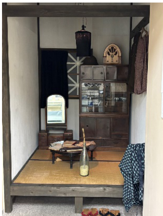
2026. 03. 07 撮影 展示：灯火管制下の部屋のように 東京大空襲・戦災資料センターにて

とに加え、実際に模型を見ることで当時の状況がより分かりやすく伝わってくる。また、空襲を体験された方のお話と再現模型を合わせて見ることで、空襲時の人々の不安や恐怖をより身近に感じることができる。