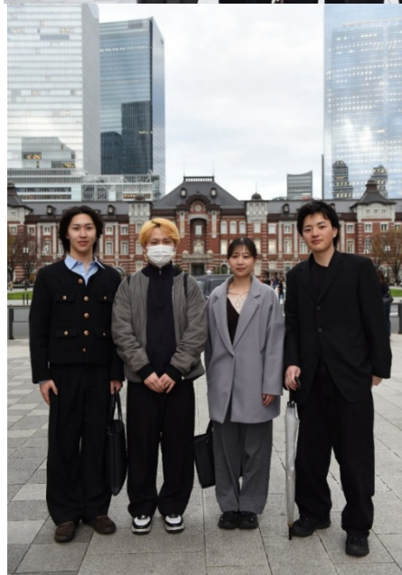
2026. 03. 19 訪問後 東京駅丸の内口にて 第2グループ